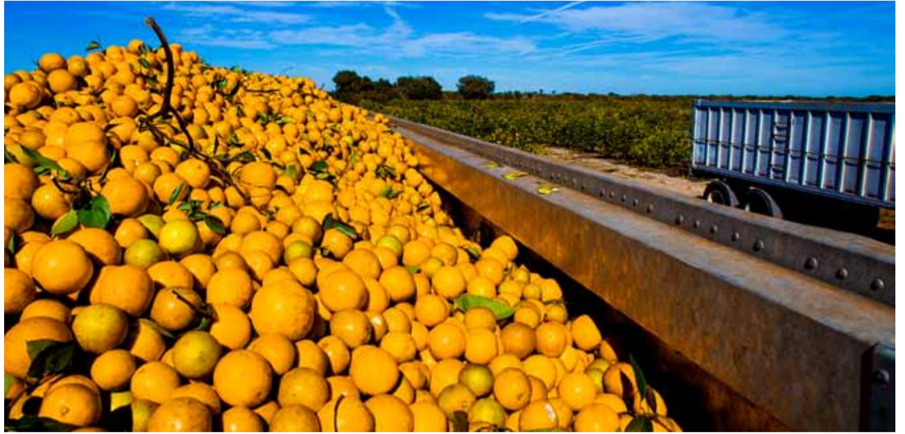
Idag är det ganska få av oss som vet hur betydelsefulla de utvandrande svenskarna var för att få igång apelsinodlingarna i Florida i slutet av 1800-talet. Florida står idag för 65 procent av USA:s citrusodlingar.